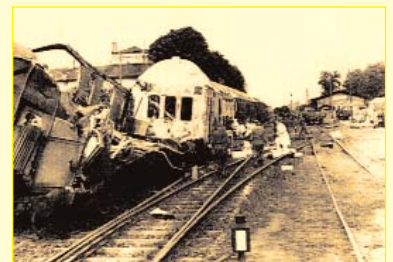
Vier Doppelstockwagen gerieten in Brand, zwei davon brannten völlig aus.