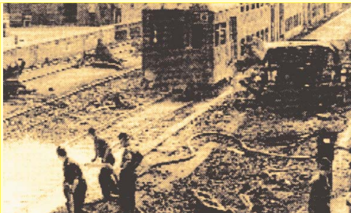
Aufräumarbeiten nach dem Inferno von Langenweddingen.